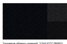
Тканевая обивка сидений "CHILICO" (9GFY)