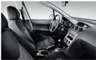
Черная Ткань Sibayak 9FFX (Access)