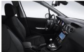
Черная Ткань Strada 9HFX (Allure)