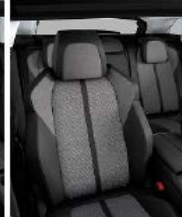
Темная искусственная кожа + ткань 'Piedimonte'