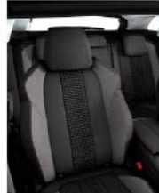
Темная ткань 'Meco'