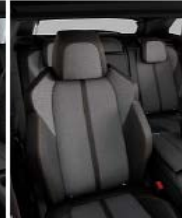
Темная искусственная кожа + ткань 'Imila'