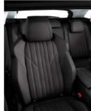
Темная натуральная кожа 'Claudia'