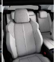
Светлая искусственная кожа + ткань 'Evron'