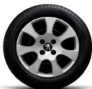
Стальные диски 16" с колпаками Tolman с шинами 215/55 R16 (Access)