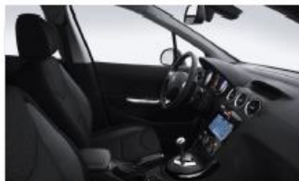
Черная Ткань Strada 9HFX (Allure)