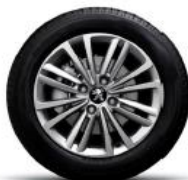
Легкосплавные диски 16" Sansiro с шинами 215/55 R16 (Allure)