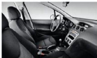
Черная Ткань Sibayak 9FFX (Access)