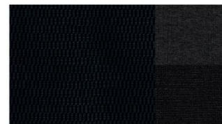
Тканевая обивка сидений Peugeot CRAN BLEU (44FY)