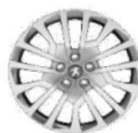
Колпак штампованных стальных дисков 17" MIAMI