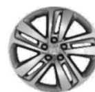
Литые алюминиевые диски 17" PHOENIX