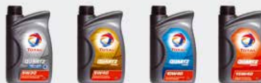
Peugeot рекомендует масла и смазки TOTAL, специально разработанные для двигателей марки.

Следует выбирать только то масло, которое соответствует специальным нормам Peugeot. Таким образом обеспечивается более высокий КПД, увеличивается срок эксплуатации двигателя и сажевого фильтра, а также повышается топливная экономичность.